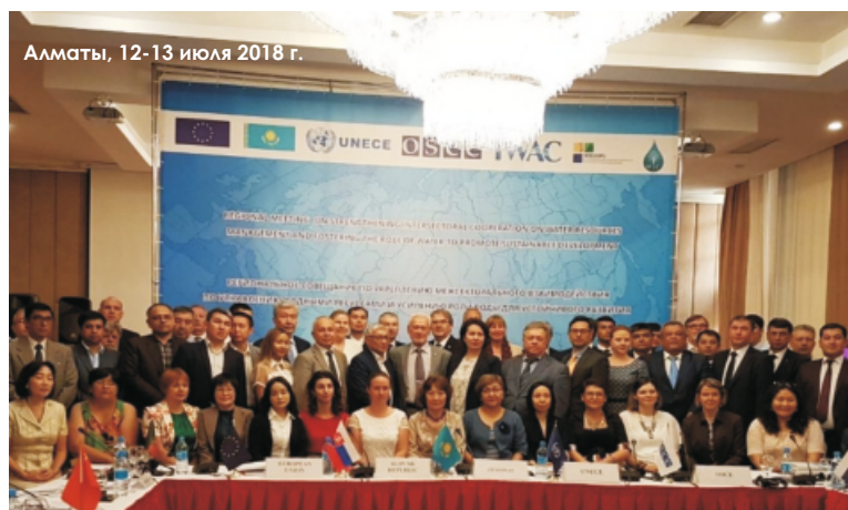
Алматы, 12-13 июля 2018 г.