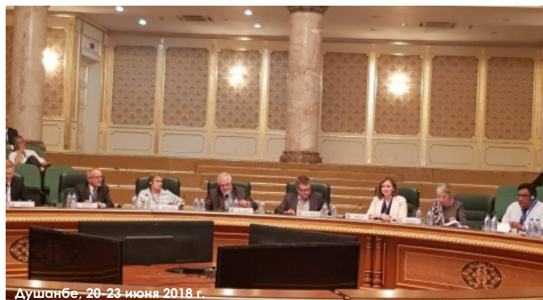
Душанбе, 20-23 июня 2018 г.