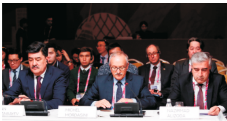
Астана, 17 мая 2018 г.