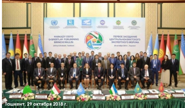
Ташкент, 29 октября 2018 г.