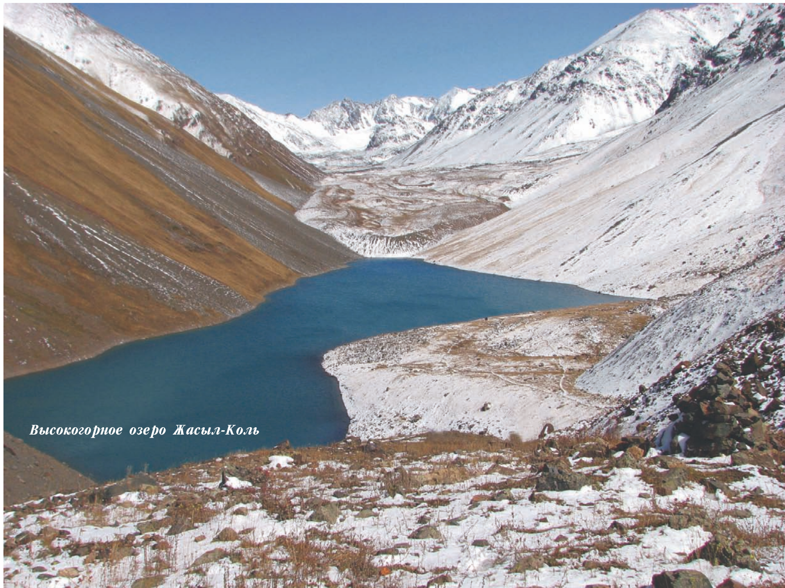
Высокогорное озеро Жасыл-Коль

Диагностический доклад и план развития сотрудничества