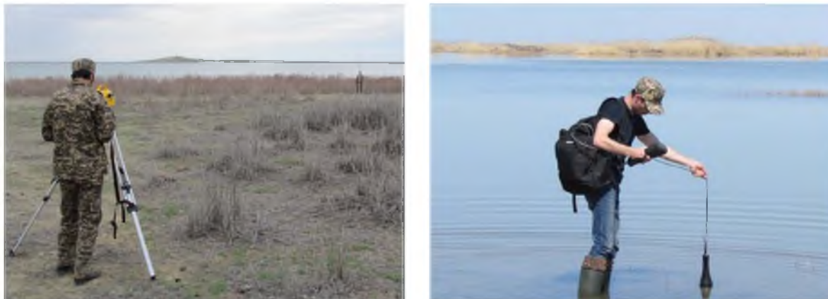
Рисунок 3 – Фотосъемка рабочих моментов исследования водоемов дельты Сырдарии

Полевые мониторинговые исследования были проведены с 20.04 по 03.05.2015 г. (рисунок 3). Пробы воды на гидрохимический анализ отбирались в постоянном месте с четкой привязкой к рабочему реперу нивелирной съемки отметок уровней воды.