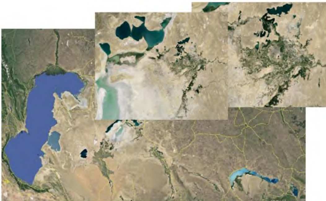
Рисунок 1 – Космоснимок дельты реки Сырдарии

озерные системы Куандаринская, Аксайская, Камыстыбасская, Акшатауская, Приморская – правобережная и левобережная часть.