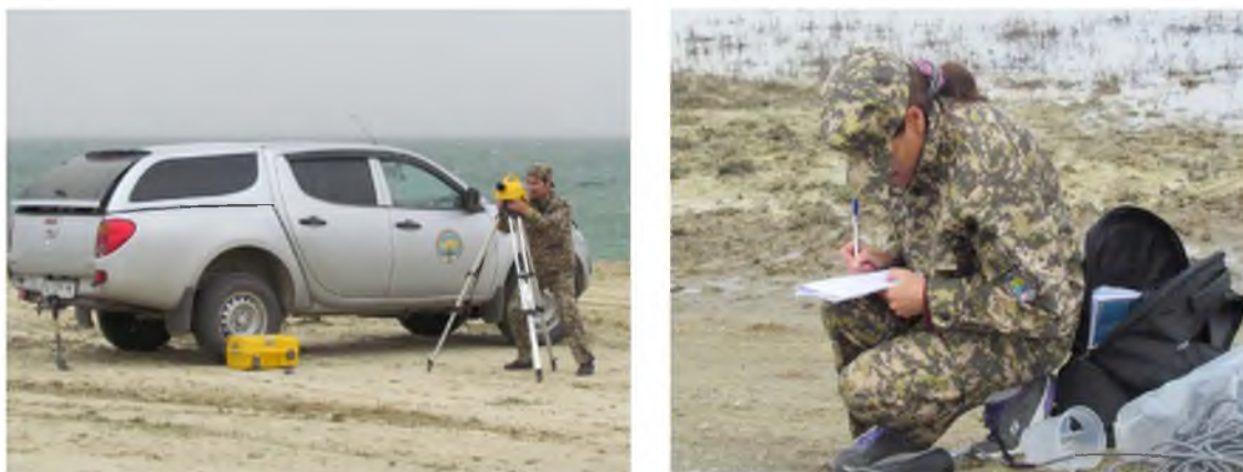
Рисунок 4 – Рабочие моменты мониторинговых наблюдений в дельте Сырдарии

В ходе гидрохимического анализа, проведенного in situ -методом (многопараметрический газоанализатор «HORIBA U-53», Япония) непосредственно на объекте исследования (намного повышающих точность гидрохимических съемок), установлено, что апрель и май 2015 г. характеризовались активными водообменными процессами в водоемах, показатели минерализации воды варьировались от 0,5 до 10,3 г/дм 3 (рисунок 4).