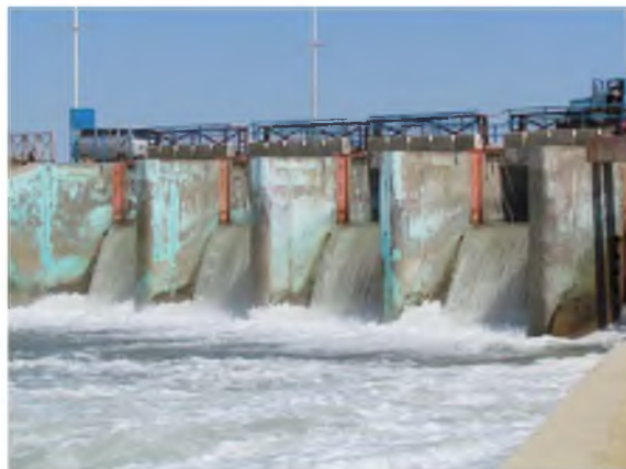
Рисунок 6 – Водосброс. Нижний бьеф Кокаральской плотины