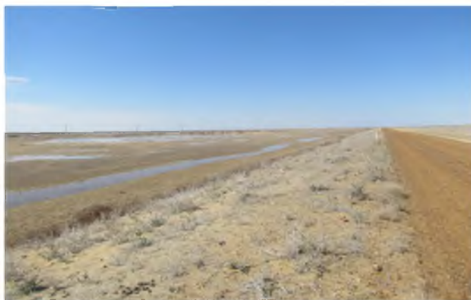
Рисунок 5 – Инфильтрационные процессы в насыпной защитной дамбе

В ходе маршрутных мониторинговых наблюдений выявлено, что на левобережной части насыпной защитной дамбы (поверх дамбы автомобильная гравийная дорога) отмечаются инфильтрационные процессы через основание дамбы с зоной выклинивания (рисунок 5). На 25 км от устья реки Сырдарии (н/б Аклакском г/у) установлены активные русловые процессы в виде плановых русловых переформирований (деформаций).