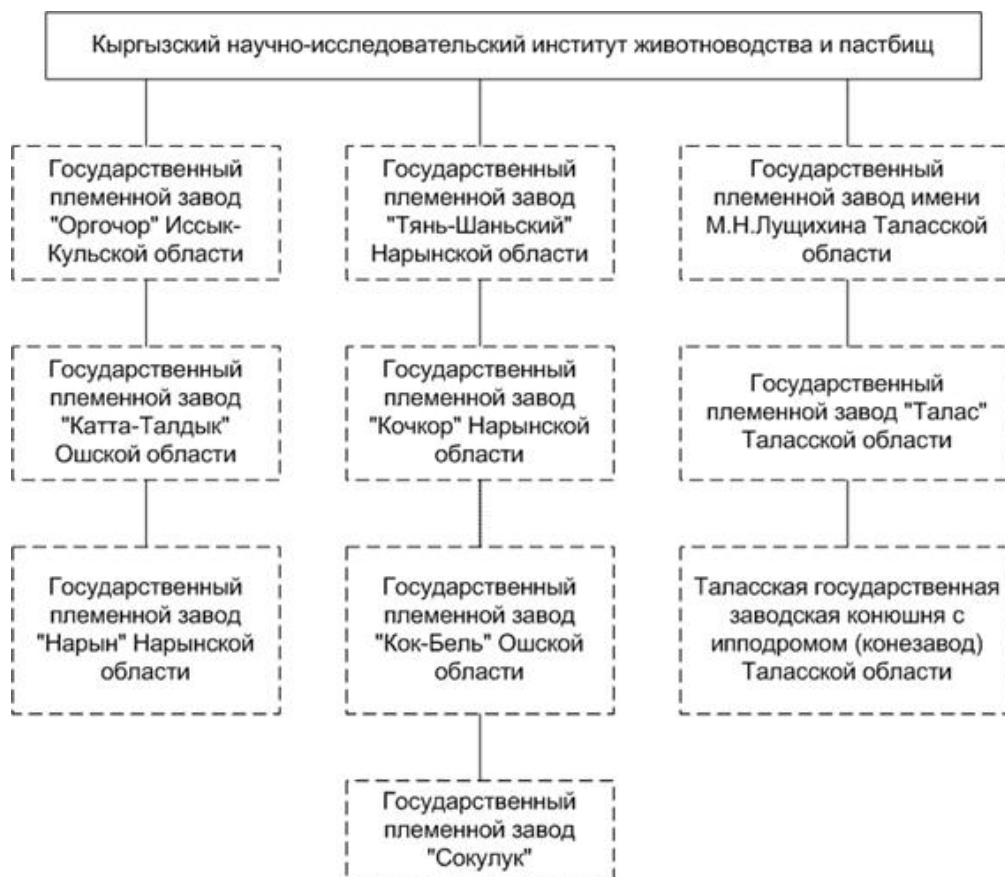
СХЕМА управления Кыргызского научно-исследовательского института животноводства и пастбищ при Министерстве сельского хозяйства Кыргызской Республики

Примечание: Пунктиром указаны хозрасчетные организации."