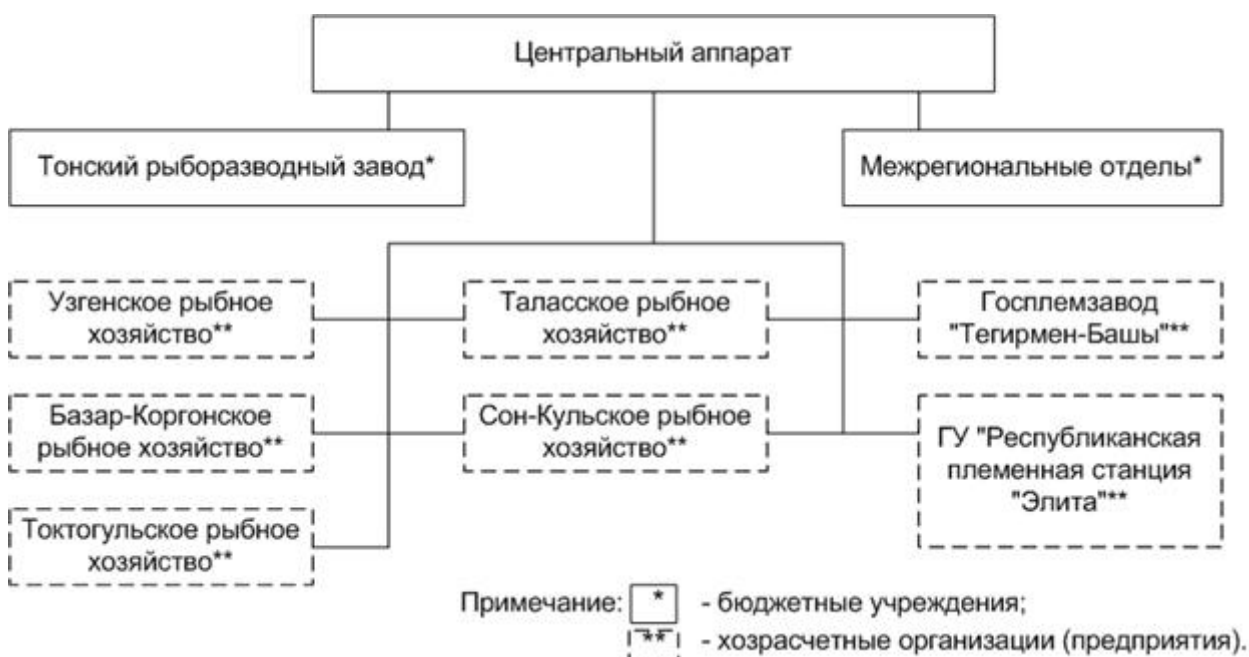
СХЕМА управления Департамента пастбищ, животноводства и рыбного хозяйства Министерства сельского хозяйства, пищевой промышленности и мелиорации Кыргызской Республики

21. В случае прекращения деятельности документы Департамента хранятся и используются в соответствии с Законом Кыргызской Республики "О Национальном архивном фонде Кыргызской Республики".