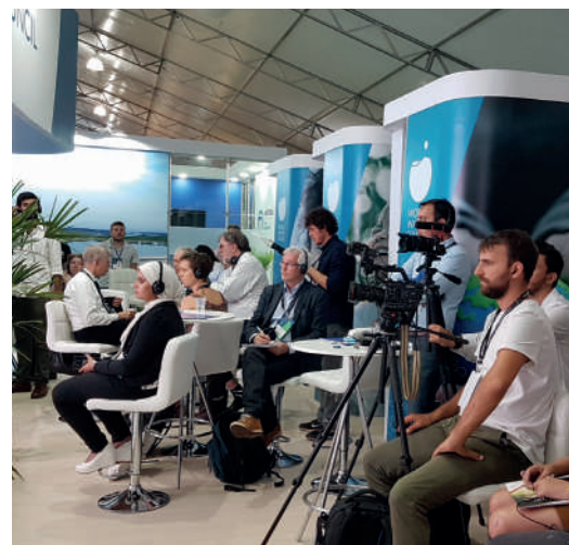
Журналисты, присутствующие на пресс-конференции в павильоне Совета