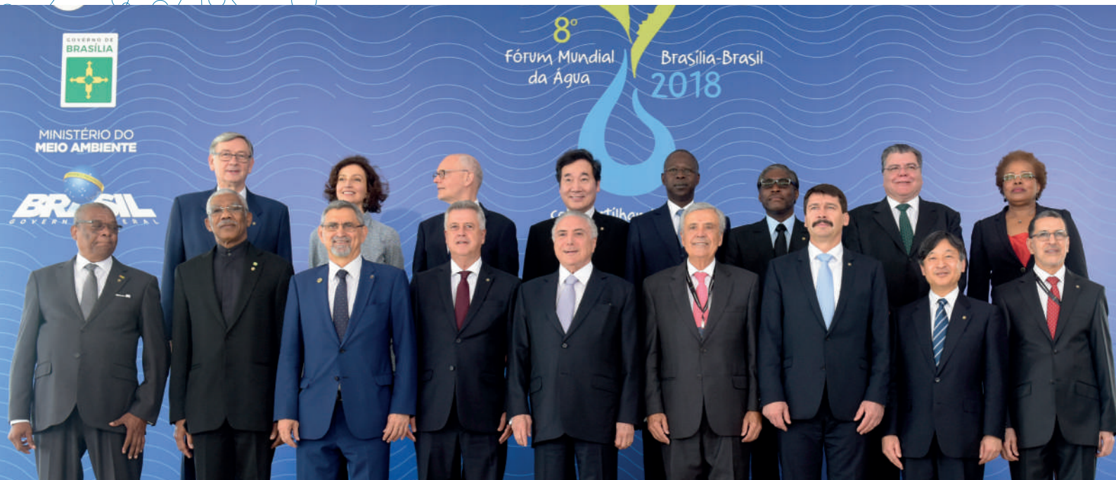
Фото. Открытие 8-го Всемирного водного форума. Президент Бразилии Мишел Темер (в центре) приветствует Глав государств и Президента Всемирного Водного Совета во дворце Итамарати, 19 марта.