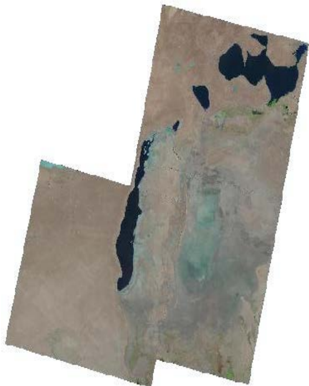
Снимки Landsat 8 OLI, полученные НИЦ МКВК 17 сентября 2021 года

(на основе данных НИЦ МКВК) http://www.cawater-info.net/aryl/data/monitoring_amu.htm