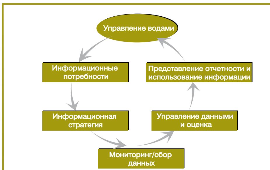
Диаграмма 3. Мониторинг и оценка, проводимые в целях управления водными ресурсами

Экспериментальные проекты играют важную роль в демонстрации полезности Руководящих принципов мониторинга и оценки трансграничных вод ЕЭК ООН и в выполнении обязательств по мониторингу, предусмотренных в Конвенции по водам. Они помогли создать эффективные и действенные программы мониторинга и оценки, отличающиеся устойчивостью в конкретных экономических условиях соответствующих стран. Кроме того, экспериментальные проекты помогли завязать двустороннее и многостороннее сотрудничество, способствовавшее укреплению институтов и формированию потенциала.