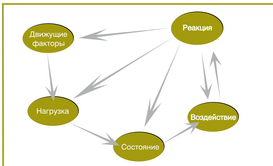
Диаграмма 1. Концепция «Движущие факторы - нагрузки - состояние - воздействие - реакция» (DPSIR)

Чтобы составить полезную программу мониторинга и оценки, нужно хорошо знать различные виды использования и функции речного бассейна, а также связанные с ними проблемы управления водами и иметь их приоритезированное описание в задокументированном виде. Взаимосвязи между различными проблемами управления водами можно пояснить на примере концепции «Движущие факторы - нагрузки - состояние - воздействие - реакция» (DPSIR) (диаграмма 1), которая была принята Европейским агентством по окружающей среде (ЕАОС).