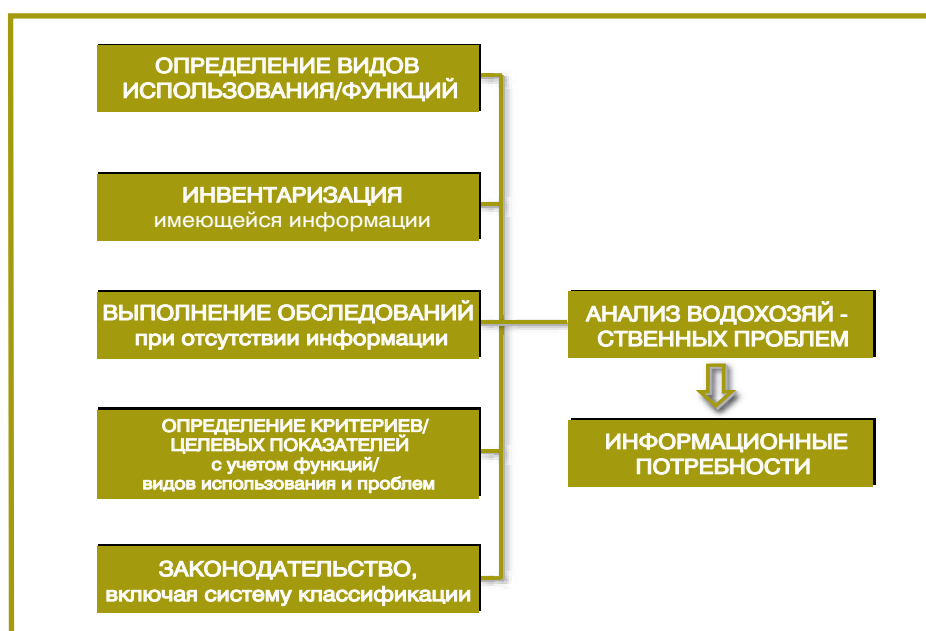
Диаграмма 4. Анализ проблем управления водными ресурсами.

Для определения проблем и приоритетов, связанных с использованием трансграничной реки и ее охраной, необходимы несколько видов деятельности. К ним относятся определение функций и видов использования речного бассейна, проведение инвентаризации на основе имеющейся (и доступной) информации, выполнение обследований (при отсутствии информации), определение критериев и целевых показателей и оценка водного законодательства в прибрежных странах для определения положений, имеющих важное значение для мониторинга и оценки (диаграмма 4).