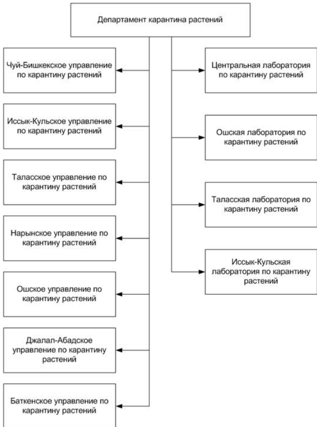
СХЕМА управления Департамента карантина растений Министерства сельского хозяйства, пищевой промышленности и мелиорации Кыргызской Республики