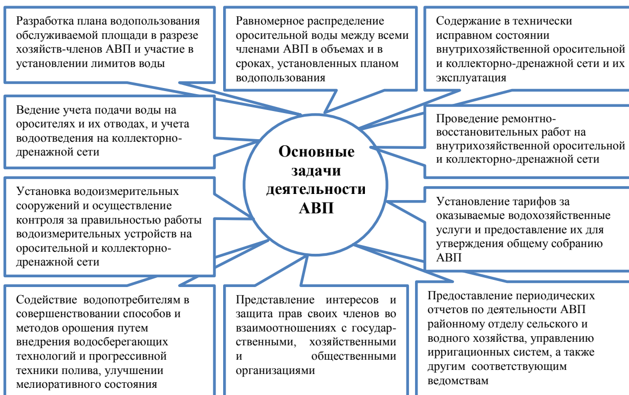
Рис. 1 - Основные задачи деятельности АВП 1