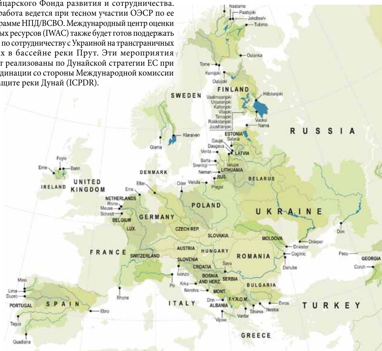
Трансграничные воды в Европе. Карта производства: ZOI Environment Network, март 2011

В Киргизстане процесс диалога начался в 2008 г. с акцентом на создание Бассейнового совета по бассейну реки Чу и разработку плана действий по устойчивому управлению водными ресурсами, безопасности питьевой воды и надлежащему водоотведению в соответствии с Протоколом по проблемам воды и здоровья. Прошло три заседания РК. В результате диалога разработаны два политических пакета, которые включают Постановление по созданию Бассейнового совета по бассейну реки Чу и План действий по реализации Целей развития тысячелетия в сфере водных ресурсов с помощью осуществления Протокола по проблемам воды и здоровья. В 2010 г. процесс НПД был прерван политическими изменениями, произошедшими в стране. Четвертое заседание РК назначено на май 2011 г. Оно будет посвящено институциональным аспектам ИУВР и национальной политике по трансграничному сотрудничеству. В 2010-2012 гг. НПД/ИУВР в Киргизстане поддерживается ЕС и правительством Финляндии.