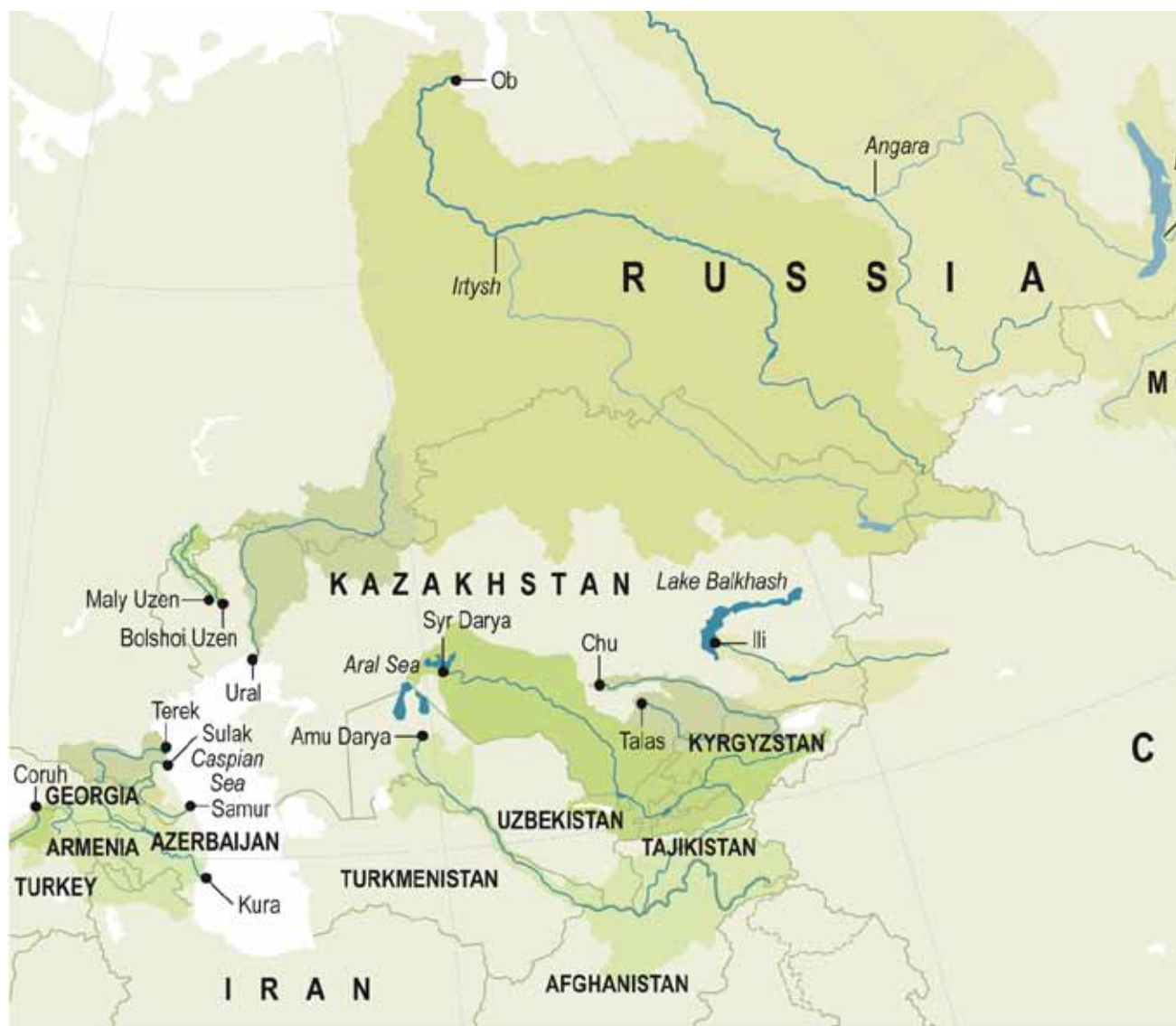
Трансграничные воды на Кавказе и в Центральной Азии. Карта производства: ZOI Environment Network, март 2011

В марте 2010 г. прошел подготовительный визит Секретариата ЕЭК ООН. Стартовая конференция НПД состоялась в декабре 2010 г., а в апреле 2011 г. было проведено первое заседание Руководящего комитета. В рамках НПД/ИУВР в Туркменистане планируется создать экспертную группу, которая поможет государству в принятии стандартов Конвенции по трансграничным водам ЕЭК ООН, включая принципы ИУВР, закрепленные в ней, по сотрудничеству на национальном и трансграничном уровне и поддержит вхождение Туркменистана в Конвенцию и начало ее реализации. В 2011 г. планируется проведение национального семинара по ИУВР. НПД/ИУВР в Туркменистане поддерживается фондами Министерства иностранных дел Норвегии, ЕС и GIZ.