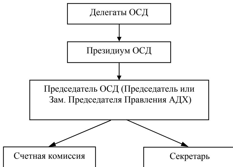
Рис. 3. Структура Общего собрания дехкан АДХ Саматов