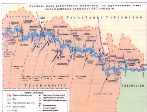
Рис.2. Этрапские производственные объединения водного хозяйства Туркменистана в среднем течении Амударьи

риториальная организация управления водными ресурсами не обеспечивает равномерную обеспеченность водой по всей длине гидрографической сети. Совершенствование управления водными ресурсами связано с переходом на бассейновый принцип управления, регулирование водных отношений в границах бассейна рек и других водных объектов [15].