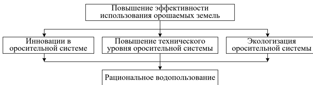
Рисунок 2 – Блок-схема направлений повышения эффективности использования орошаемых земель

При планировании водопользования должно быть выдержано условие оптимального обеспечения оросительной водой и доведения ее в необходимых количествах и в нужные агротехнические сроки до растений.