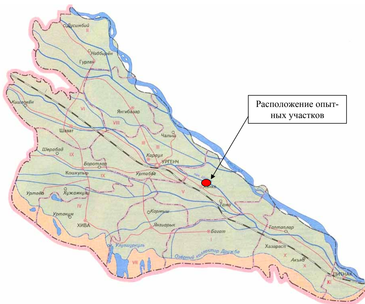
Рис. 1. Местоположение объектов исследований

Исследования эффективности встречного полива хлопчатника по бороздам на малоуклонных и засоленных землях Хорезмской области проводились в период 2004-2006 гг. на 2 опытных участках в почвенно-мелиоративных условиях, репрезентативных для Хорезмской области, в Ханкинском и Ургенчском районах Хорезмской области (рис. 1).