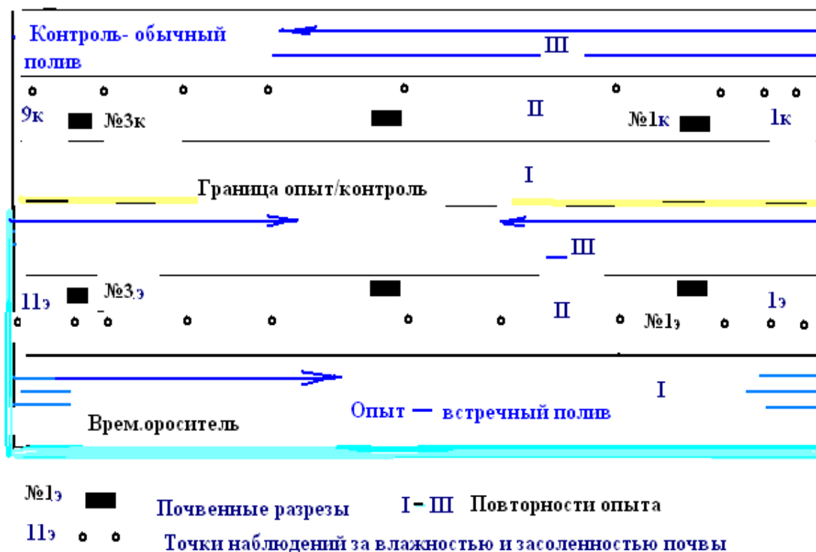
Рис. 2. Схема опытного участка для изучения эффективности встречного полива

Схема расположения почвенных разрезов и точек наблюдений за влажностью, засоленностью почв и УГВ на опыте сравнения обычного бороздового и встречного поливов показана на рис. 2.