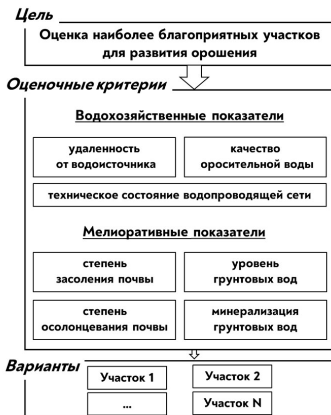
Рисунок 1 – Структура процесса принятия решения о развитии орошения Figure 1 – Structure of the decision making process on the development of irrigation

от 6 до 20 показателей. К таким характеристикам могут относиться: глубина залегания грунтовых вод, гидрогеологические параметры водовмещающих и разделяющих слоев, водно-физические свойства почв, водно-солевой баланс и режим, коэффициенты использования воды и полезного действия разных участков водопроводящей сети, уровень технического состояния гидротехнических сооружений и многое другое. Сбор данных по ним является сложной и ответственной задачей.