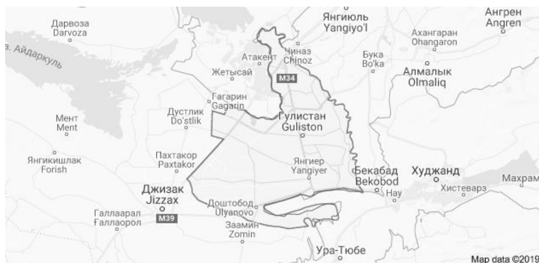
Рисунок 1 – Административная карта Сырдарьинской области Республики Узбекистан

В Сырдарьинской области коллекторно-дренажные воды (КДВ) характеризуются особыми гидрологическими и гидрохимическими режимами. Ниже приведены сведения об орошаемых площадях, обеспеченности их коллекторами и дренами, их расходах, количестве стока и величине минерализации, водно-солевом балансе орошаемых площадей. В общем по области величина орошаемой площади равна 287,84 тыс. га, и для отвода подземных вод с этих площадей функционирует дренажная сеть длиной 16189,80 км, в т. ч. 7479,13 км открытого дренажа и 8710,67 км закрытого горизонтального дренажа, 1948,24 км открытого дренажа межхозяйственные и 5530,89 км внутрихозяйственные дренажные системы (рисунок 1) [3–5].