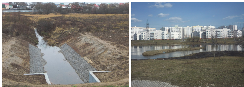
Рис. 3. Некоторые элементы пруда №3 каскада в усадьбе Чернево, 2012 г.: а – нижний бьеф после реконструкции; б - остатки разрушенной плотины в верхней части пруда