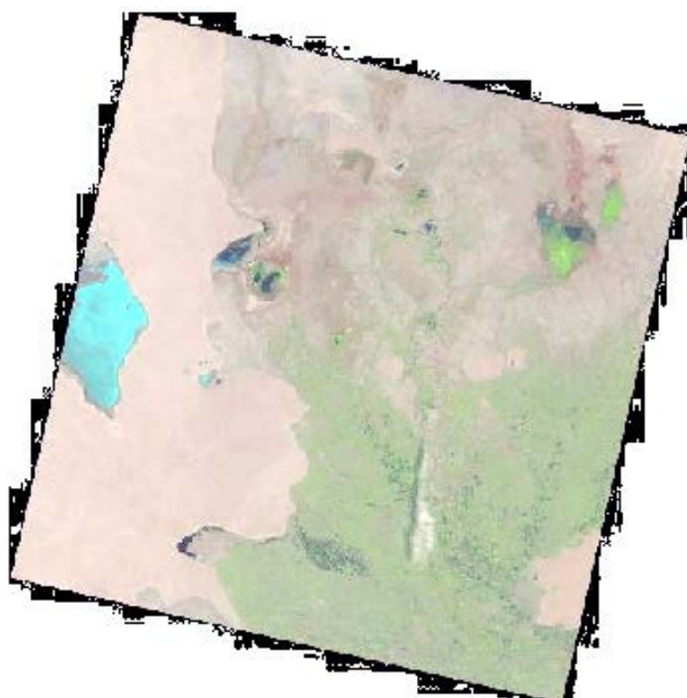
Рис. 2 Приаралье. На основе снимка Landsat 8, 27 августа 2022.