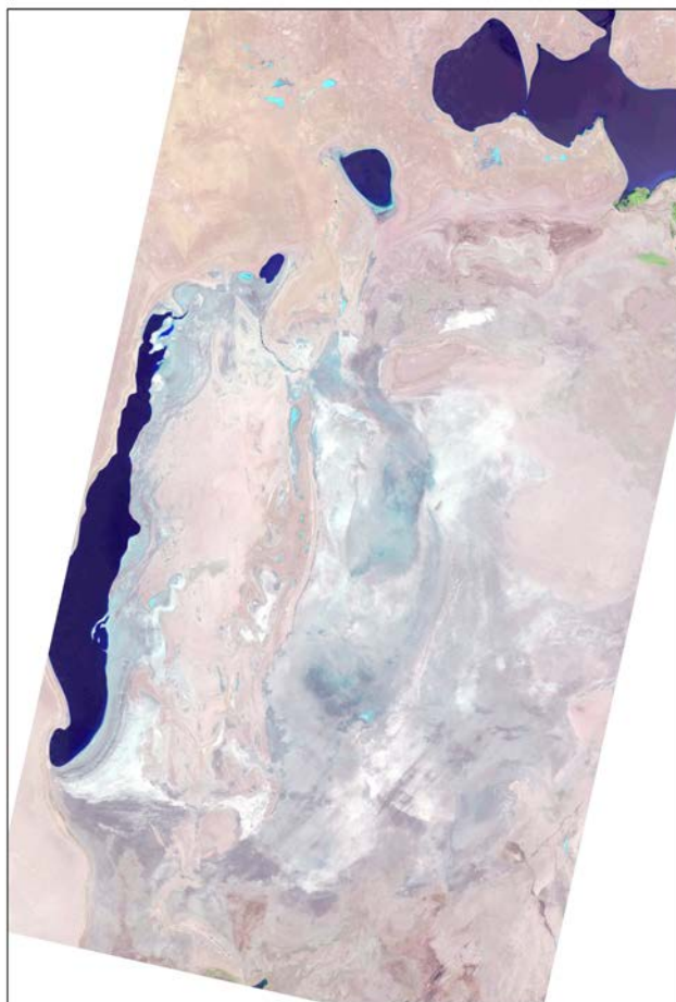
Рис. 1 Западное и Восточное Аральское море. На основе снимка Landsat 8 - 9. 13 июля

Из результатов видно что суша увеличивается и уменьшается водная поверхность кроме Междуреченского водохранилища, где водная поверхность увеличилась на 248,94 га, причиной является то что в июне месяце приточность была на 56 млн.м 3 больше чем в мае, таблица 5.