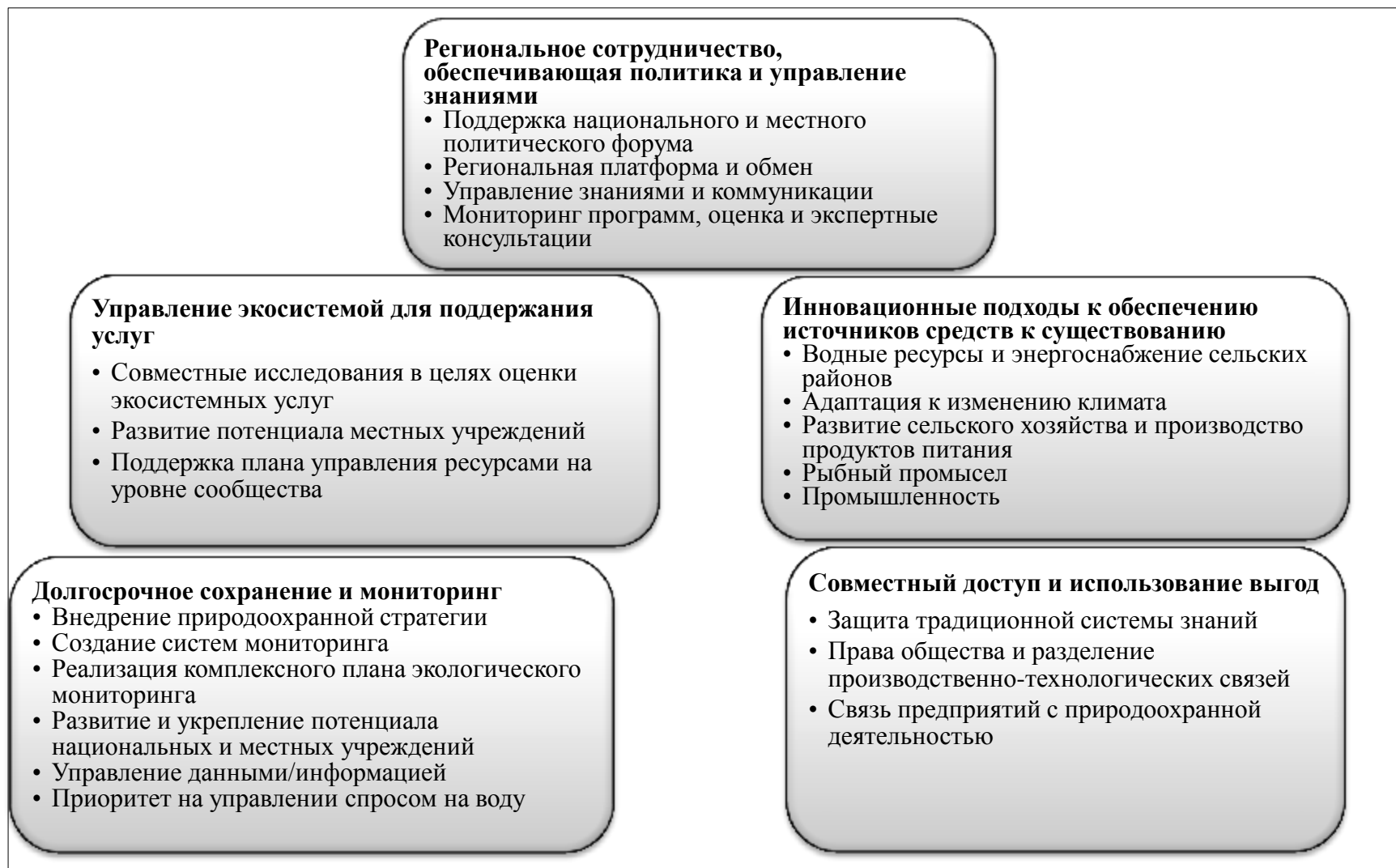
Рисунок 2. Принцип совместного использования трансграничных выгод при разделении водных ресурсов реки Кабул.