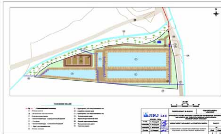
Рис. 2. Схема очистной станции села Паракар

Размер биологического пруда с аэрацией выбирался исходя из: