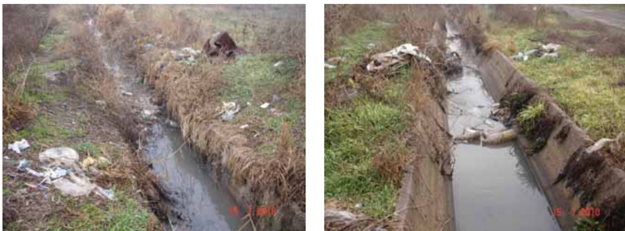
Рис. 1. Оросительный канал в селе Паракар, загрязненный сточными водами и отходами

По этой причине руководством общины была инициирована разработка пилотного проекта “Восстановление деградированных земель общины Паракар при помощи строительства биологических прудов для очистки сточных вод”. Проект разработан НВП Армении, ООО ДЖИНДЖ и благотворительным фондом “Паракар” в рамках Программ Малых Грантов ГЭФ.