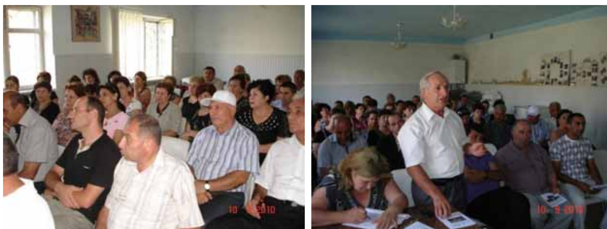
Рис. 4. Общественные слушания в селе Паракар

В течении всего проекта большое внимание уделялось на повышение информированности населения и на формирование положительного отношения людей к новой технологии очистки. С помощью встреч, круглых столов, общественных слушаний и информационных материалов информировали население о целях проекта, о намеченных мероприятиях и ожидаемых результатах.